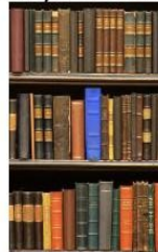
50 th percentile