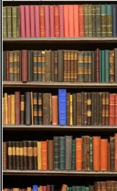
90 th percentile